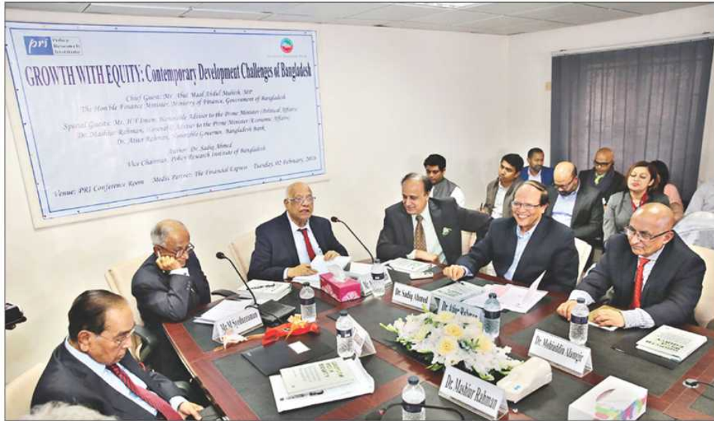
Finance Minister A M A Muhith speaking at a book-launching ceremony, organised by Policy Research Institute of Bangladesh (PRI), in the capital on Tuesday. story on page 1