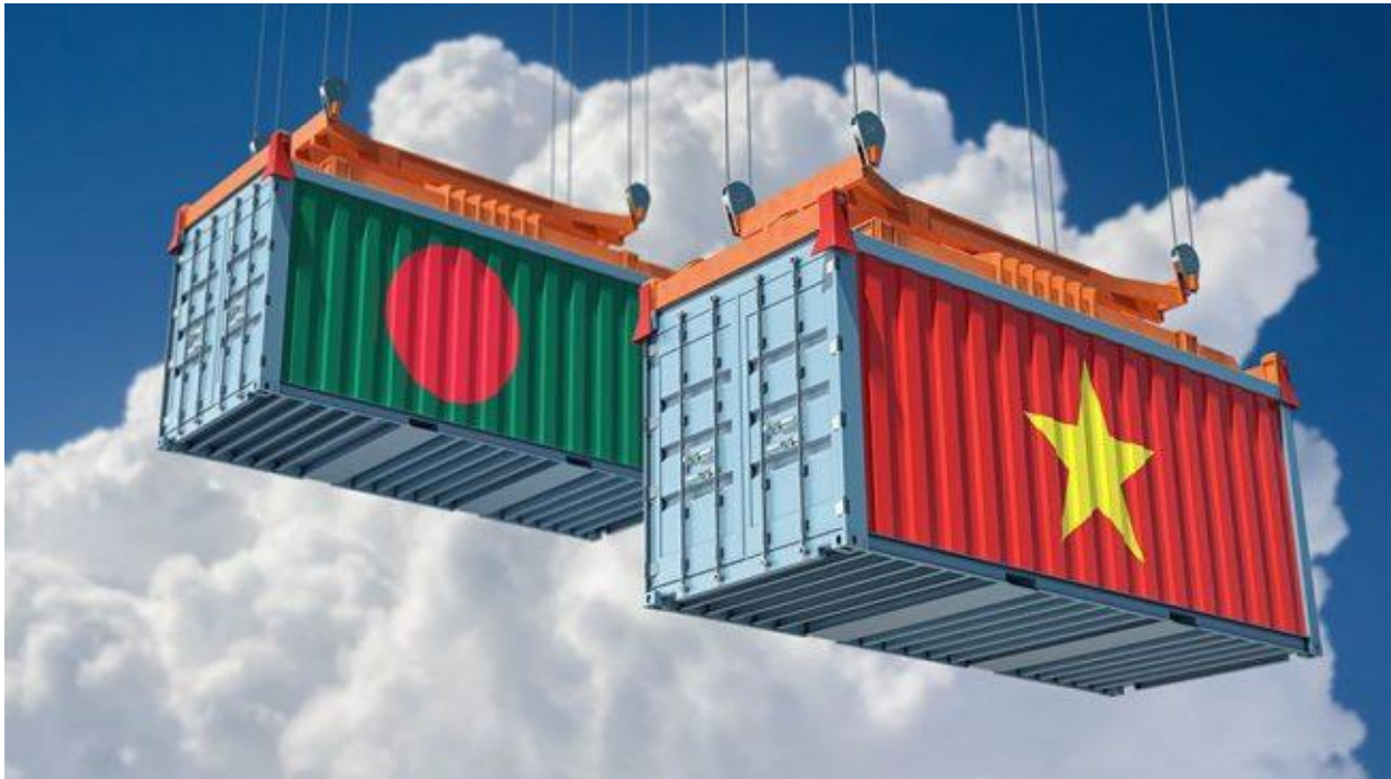
Figure: However, in terms of exports and foreign investment, Vietnam was more or less similar to Bangladesh in the 1980s. But now Vietnam is far ahead of Bangladesh by achieving a lot.

However, in terms of exports and foreign investment, Vietnam was more or less similar to Bangladesh in the 1980s. But now Vietnam is far ahead of Bangladesh by achieving a lot.