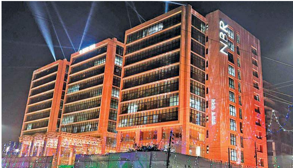
A file photo shows the headquarters of the NBR in the capital Dhaka.

https://www.newagebd.net/article/212015/trust-between-tax-admin-taxpayers-stressed-for-boosting-compliance